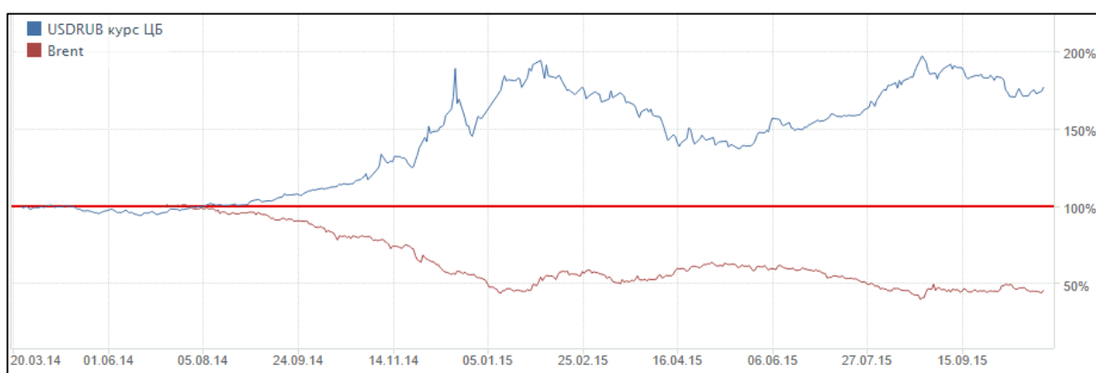
График 2. Динамика индекса USD/RUB относительно курса Brent [4].

Безусловно, не забудем и про показатель, наиболее оперативно отражающий настроения инвесторов относительно той или иной экономики - национальную валюту. Уж тут-то нам есть чем похвастаться (автор ехидно улыбнулся). Наиболее наглядно неустойчивость нашей экономики демонстрирует зависимость курса рубля от цены за баррель нефти марки Brent (График 2).